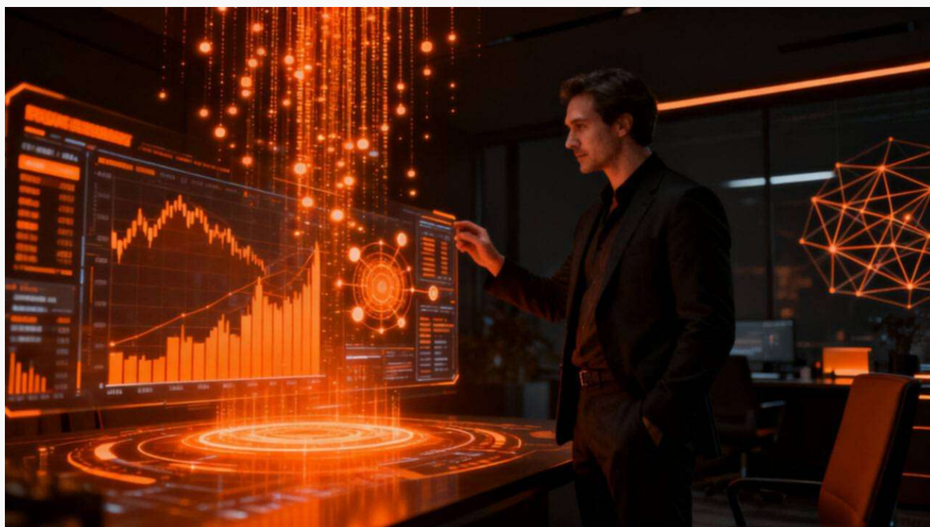
El 73% de líderes financieros considera la inteligencia artificial clave para el futuro de la gestión de activos