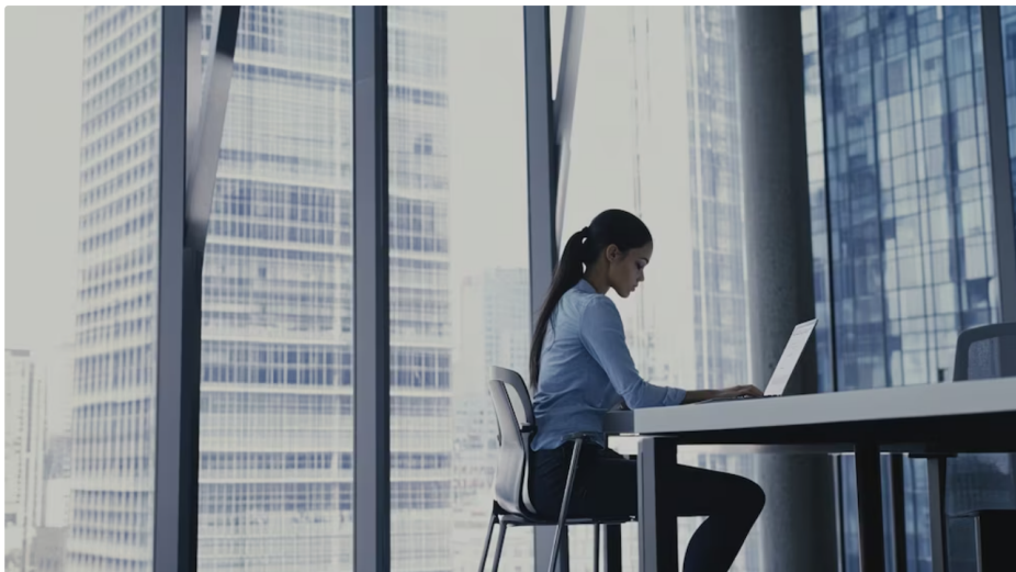
Una mujer trabaja en una oficina. (Imagen Ilustrativa Infobae)

Canosa subraya la importancia de contar con modelos alcanzables: “Ahora las niñas de ocho años pueden pensar en la de Bankinter y en Ana Botín. Porque demuestran que a veces se cumple. Además, no necesitamos solo heroínas, necesitamos mujeres reales . Porque Marie Curie y Coco Chanel son heroínas, son algo fuera de lo normal, no nos podemos ver reflejadas en sus historias, necesitamos algo mucho más cotidiano”.