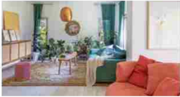
Con el color de la alegría. Recorremos la casa de la diseñadora Marina Maiztegui