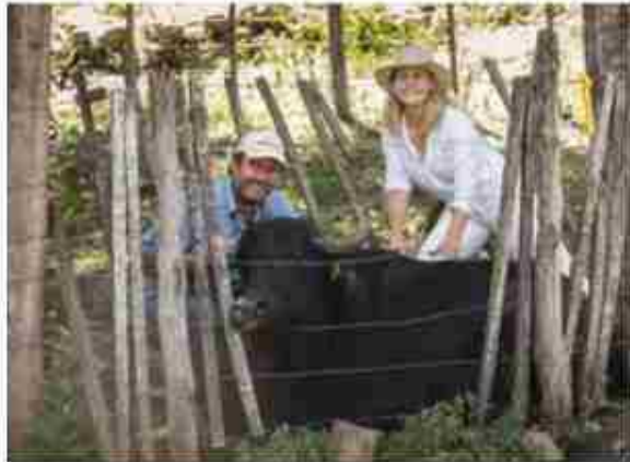
Historia de vida. Se animaron a criar búfalos en las sierras cordobesas