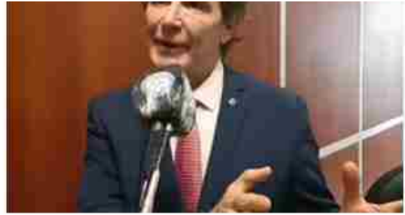
Tucumán: destituyen al juez que denunció presiones de la Corte y del gobernador

Parque Saavedra. Dos PH ferroviarios convertidos en hogar actual y sustentable