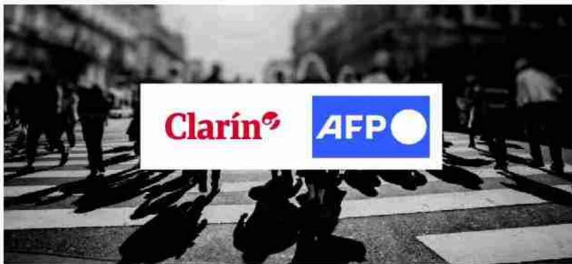
Clarín AFP Agencias