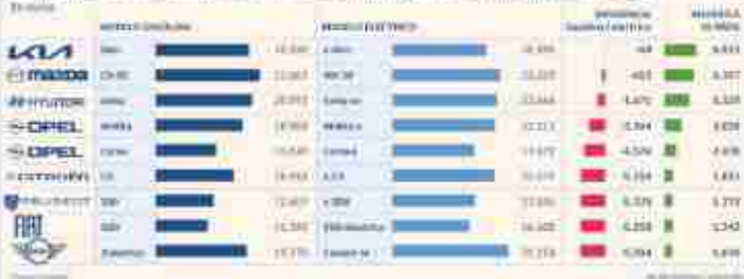
La diferencia de precios entre gasolina y eléctrico, más pequeña que nunca gracias al Moves III

La compañía de origen británico subraya que adquirir un coche eléctrico en vez de uno de gasolina puede suponer un ahorro de hasta 7.000 euros después de unos 10 años y 100.000 kilómetros.